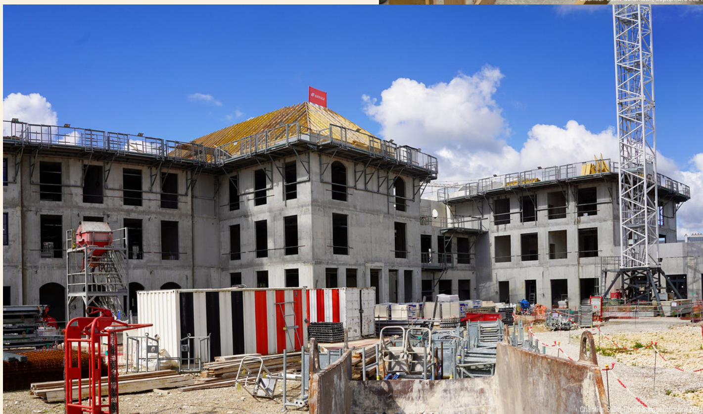
Chantier Saint-Colomban, septembre 2024