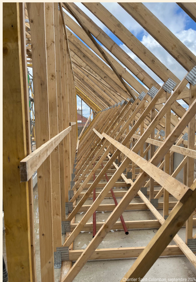
Chantier Saint-Colomban, septembre 2024

Cette nouvelle Institution promet de devenir un lieu d'éducation et d'épanouissement pour les générations à venir, grâce à l'implication et au soutien de tous les partenaires et acteurs impliqués.